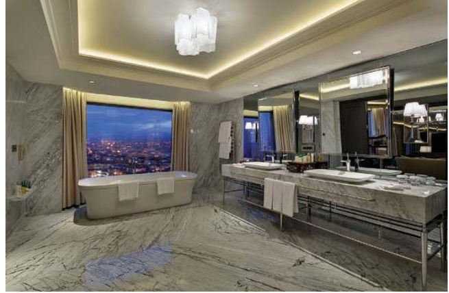
KRAL DAİRESİ BANYOSU