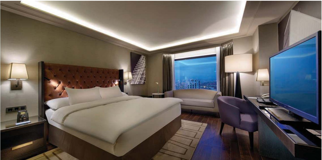
EXECUTIVE STANDART ODA