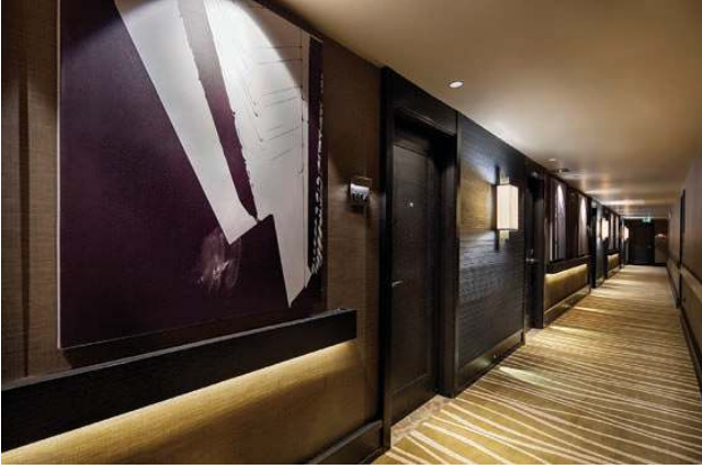
EXECUTIVE ODA KORİDORU